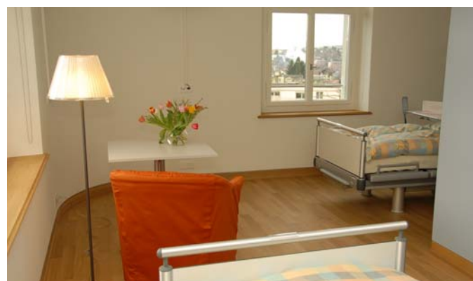
Eckzimmer mit schöner Fernsicht

Der Leistungsauftrag des Kantons für das Kompetenzzentrum umfasst die Behandlung, Pflege und Begleitung von erwachsenen unheilbar kranken Menschen mit komplexen Symptomen (Schmerzen, Atemnot etc.) und/oder psychosozialen Problemen, mit dem Ziel der Verbesserung ihrer Lebensqualität und, wenn möglich, der Rückkehr nach Hause. Um möglichst vielen Menschen dabei zu helfen, die letzte Lebensphase in ihrer eigenen Umgebung zu verbringen, gehört die Unterstützung und Beratung der Spitex und der Hausärzte ebenfalls zum Auftrag des Palliativzentrums. Wenn eine Rückkehr nach Hause nicht mehr realistisch ist, werden Patienten und ihre Angehörigen im Abschied und Sterben begleitet. Es wird alles unternommen, das Leiden zu lindern und die jeweiligen Wünsche und Bedürfnisse ins Zentrum zu stellen.