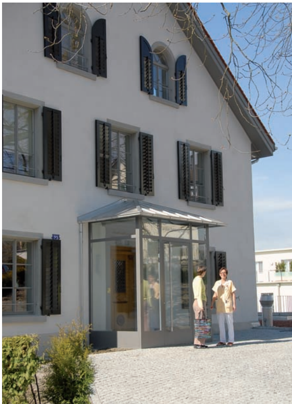
Palliativstation Villa Sonnenberg