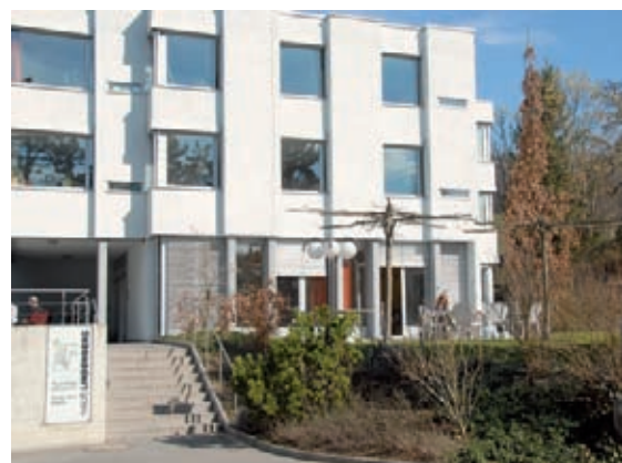
Haus Lindenberg, Psychiatrie