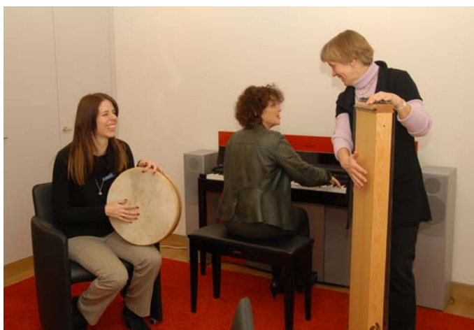
Kunst- und Ausdrucksorientierte Psychotherapie

Die Villa Sonnenberg ist in Konzept, Architektur und Angebot pionierhaft und findet weit herum Beachtung. Sie unterstreicht den innovativen Geist des Spitals Affoltern und lebt das Modell Affoltern.