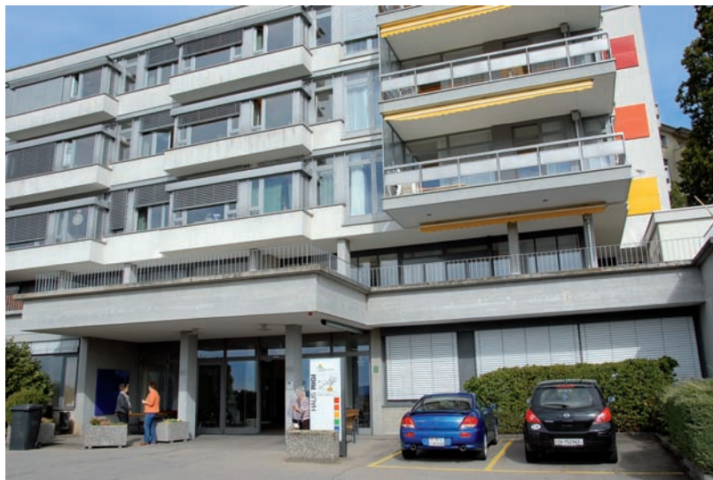
Haus Rigi, Langzeitpflege