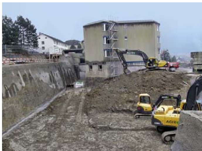
im Oktober 2009

Bis Frühjahr / Frühsommer dieses Jahres soll der Rohbau beendet sein. Danach beginnt die intensive Zeit des Innenausbaus. Ende 2010 erwarten wir die Übergabe des Erweiterungsbaus, zur Einrichtung und Inbetriebnahme. In der ersten Hälfte 2011 wird das heutige Haus Pilatus nach 25 Betriebsjahren saniert, und wir hoffen auf einen Abschluss der Bauarbeiten per Mitte 2011.