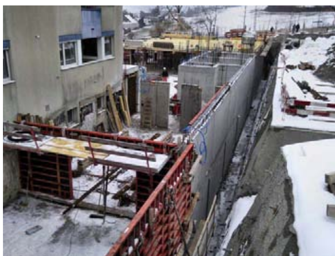
im Februar 2010

Die Langzeitpflege Sonnenberg des Spitals Affoltern verfügt derzeit lediglich über eine Demenzwohngruppe im Haus Pilatus mit acht Betreuungsplätzen. Dieses Angebot deckt den heutigen Bedarf seit langem nicht mehr ab. Zu viele demente Menschen müssen in unpassenden Strukturen betreut und gepflegt werden. Sie sind ohne Halt und durch die vielen Reize und Konfrontationen überfordert. Gleichzeitig erleben sie zu viel Einengung und zu wenig Freiraum. Die neu erstellte Demenzstation im Erweiterungsbau wird über zwölf Betreuungsplätze mit einer angepassten räumlichen und personellen Struktur verfügen. Den geschützten, ebenerdigen Garten können die Bewohner selbstständig nutzen und so ihr Bewegungsbedürfnis ausleben. Auf drei Etagen werden zwölf zusätzliche Pflegezimmer, Therapie- und Schulungsräume, ein Andachtsraum und weitere Räumlichkeiten erstellt.