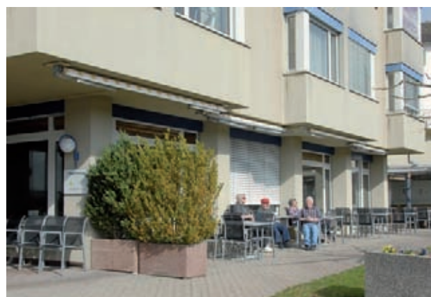
Haus Pilatus, Langzeitpflege