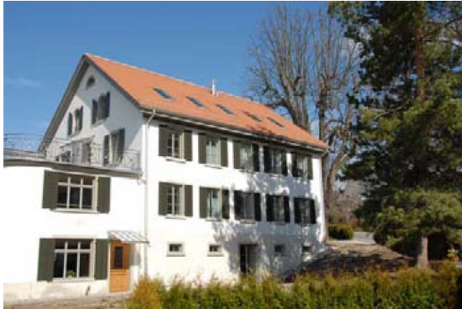
Villa Sonnenberg mit Sonnenterrasse, im Frühjahr 2010 wird die Gartenanlage fertig angelegt sein.

Am 29. Januar 2010 konnte das wunderschöne Kompetenzzentrum Palliative Care mit einer eindrucklichen Feier eingeweiht werden. Am 8. Februar 2010 wurde die erste Patientin aufgenommen. Der Weg dazu war lang und steinig. Denn die Idee, das ehemalige „Doktorhaus“ (die alte Villa an der Sonnenbergstrasse) in ein Palliativ-Zentrum umzuwandeln, ist schon über 10 Jahre alt.